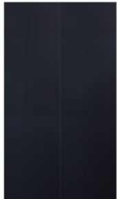
STARfix III wird mit CIS-Solarmodulen ohne Rahmen montiert